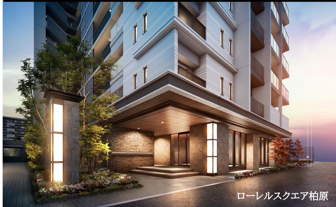
ローレルスクエア柏原