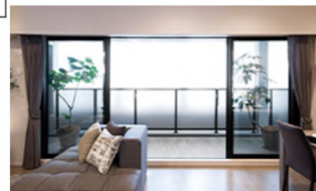
開放感を演出するオープンサッシ