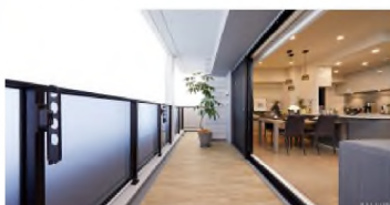
ゆとりのバルコニー空間

※Vtype | 22号室:販売価格(税込)2,960万円の返済例(概算) [借入額:2,960万円、頭金:0円、月々返済額:62,240円、ボーナス時加算:75,955円] ※提携ローンのご案内○提携金融機関/りそな銀行○申込資格・条件/借入時満20歳以上満70歳未満、最終返済時満80歳未満の方/前年の税込年収が100万円以上の方/給与所得者の場合は、勤続年数が1年以上の方。給与所得者以外の場合は、勤続または営業年数が3年以上の方。○融資限度額/50万円以上1億円以内(1万円単位)○返済期間/1年以上35年以内(1年単位)○利率(変動金利の場合)年0.35%(店頭表示金利2.475%から2.125%引き下げ)○返済方法/変動金利(融資手数料型)○生命保険/銀行指定の団体信用生命保険にご加入いただけます。○融資手数料/借入金額の2.2%○事務取扱手数料33,000円(税込)掲載融資条件は2022年9月30日現在のものです。金融情勢の変化、金融機関、保証会社により、融資条件・金利等は変更される場合があります。またローンは一定要件該当者が対象となりますので、予めご了承ください。詳しくは係員までお問い合わせください。